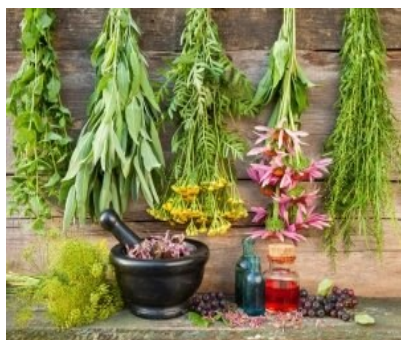
VISITE POSSIBILI: Giardino dei Semplici (colline pesaresi)