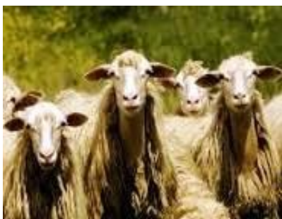
VISITE: Caseificio artigianale, animali in azienda