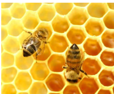
VISITA: Azienda di apicoltura

Programmi di 1/2 giornata, estendibili a giornata piena, che prevedono facile passeggiata per conoscere il territorio e visita ad aziende o attività artigianali: capiamo come nasce un prodotto naturale, il suo valore nutrizionale o culturale, e interpretiamo il vitale rapporto tra animali piante e uomo che permette di trasformare le preziose risorse ambientali in concrete opportunità a nostro beneficio