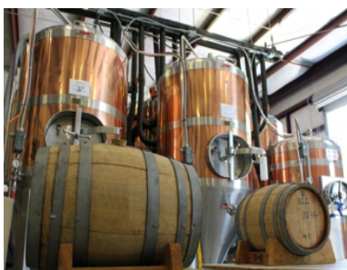
VISITA: Birrificio artigianale