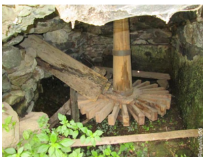
VISITA: Mulino meccanico o idraulico