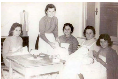
VISITE: Museo Pie Artigiane Cristiane, Castello e Pieve di S. Stefano in Candelara