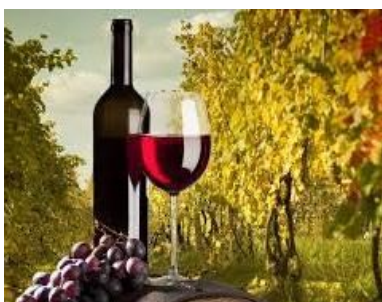
VISITA: Azienda agricola vigneti e cantina