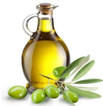
VISITA: Frantoio oleario

Programmi di 1/2 giornata, estendibili a giornata piena, che prevedono facile passeggiata per conoscere il territorio e visita ad aziende o attività artigianali: capiamo come nasce un prodotto naturale, il suo valore nutrizionale o culturale, e interpretiamo il vitale rapporto tra animali piante e uomo che permette di trasformare le preziose risorse ambientali in concrete opportunità a nostro beneficio